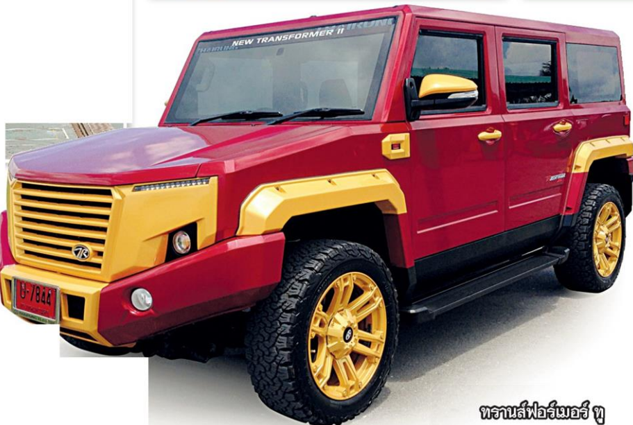
ทรานส์ฟอร์เมอร์ทู

โรงงานทั้งหมดของไทยรุ่งฯ มีกำลังการผลิตประกอบรถยนต์รวมทั้งปีละ 50,000 คัน