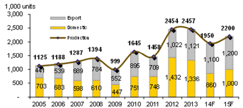
Figure 3: Thai vehicle production, domestic sales and exports